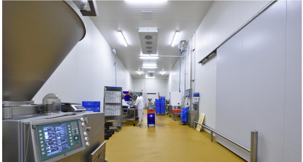
Onze referentie in Jette (België): Walravens NV