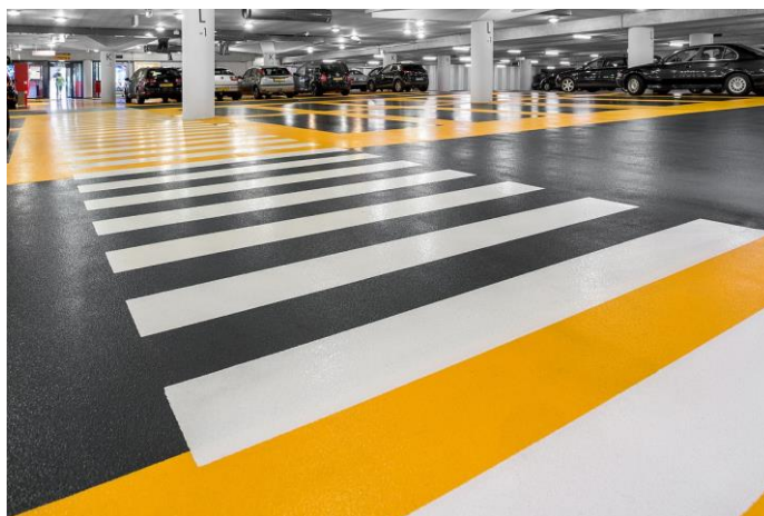
Onze referentie in Enschede (Nederland): Parkeergarage van Heekplein