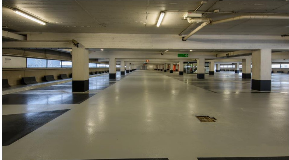
Onze referentie in Rotterdam (Nederland): Parkeergarage Weena